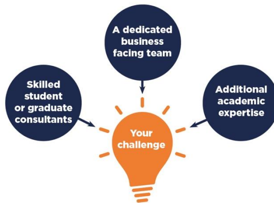
ნახ. 1: KRISP პროგრამის ვიზუალიზაცია

პროგრამაში გამოყენებული კონცეფციები და მეთოდოლოგია ეყრდნობა ინოვაციურ ბრიტანულ გამოცდილებას. კერძოდ, კილის უნივერსიტეტის „კვლევისა და ინოვაციების მხარდაჭერის პროგრამას“ ( Keele Research and Innovation Support Programme - KRISP ), რომელიც დიდ ბრიტანეთში საგანმანათლებლო დაწესებულებებისა და ბიზნესებს შორის მჭიდრო თანამშრომლობის სტიმულირებისა და მხარდაჭერისთვის შეიქმნა; კონცეფცია მოიცავს კერძო სექტორსა და უნივერსიტეტს შორის თანამშრომლობას კონკრეტული ბიზნეს პრობლემების გადასაწყვეტად, სტუდენტების პრაქტიკული მონაწილეობით. პროგრამა კერძო სექტორისთვის იძლევა შესაძლებლობას რესურსების დაზოგვით მიიღოს წვდომა დარგში უახლეს აკადემიურ ცოდნასა და ექსპერტიზაზე, აგრეთვე სტუდენტთა გუნდის ჩართულობაზე აკადემიური პერსონალის ხელმძღვანელობით, რომელიც ორიენტირებული იქნება მათი კონკრეტული პრობლემის გადაწყვეტაზე.